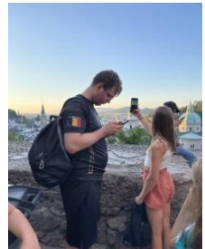
LSO Halle, Spaziergang über den Mönchsberg