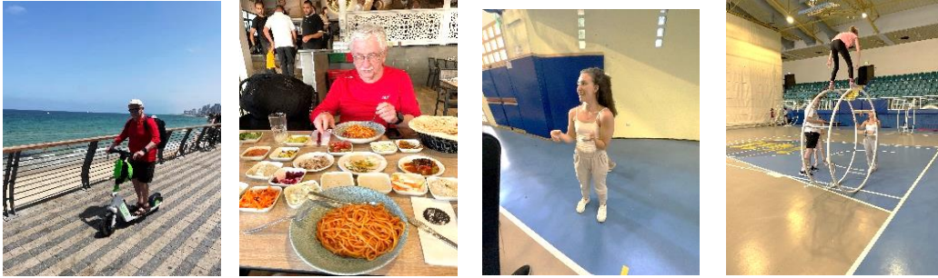
Jerusalem am 13.6.2022