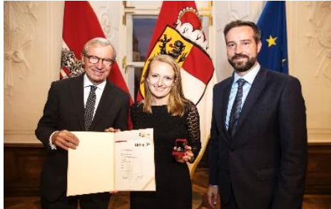
Tanja Sportehrenzeichen in Silber