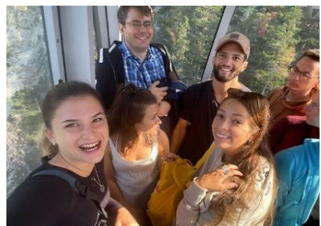
Erasmusprogramm am Weg zur Eisriesenwelt