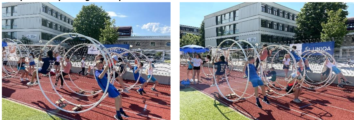
Uniqa Trendsporttage des Sportunion Landesverbandes