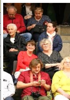
Mutter und Oma Keracs als Zuschauer